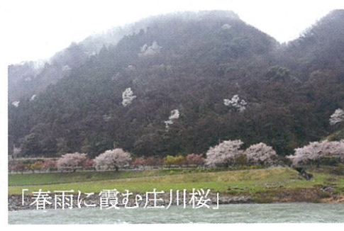
「春雨に霞む庄川桜」